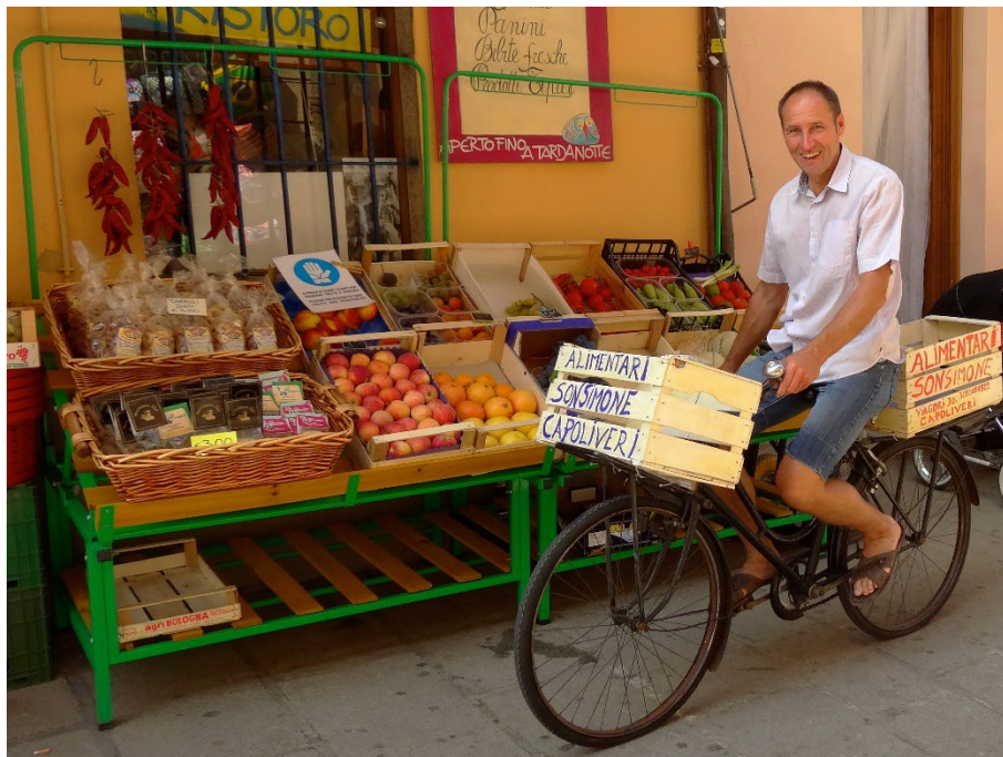
Ich war schon mal vorab unterwegs in Italien

Einige Etappen sind schon etwas sportlich, dafür wird die Landschaft entschädigen. Hoffe es geht alles gut, wegen dem ..., na ihr wisst schon.