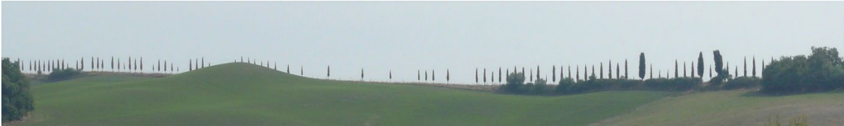
Die Skyline von San Gimignano