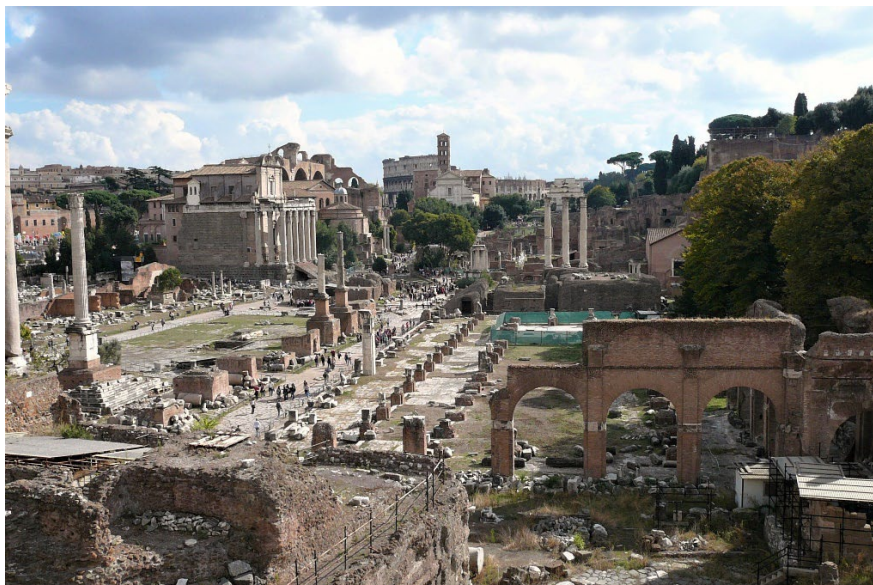
Blick vom Forum Romanum zum Colosseum