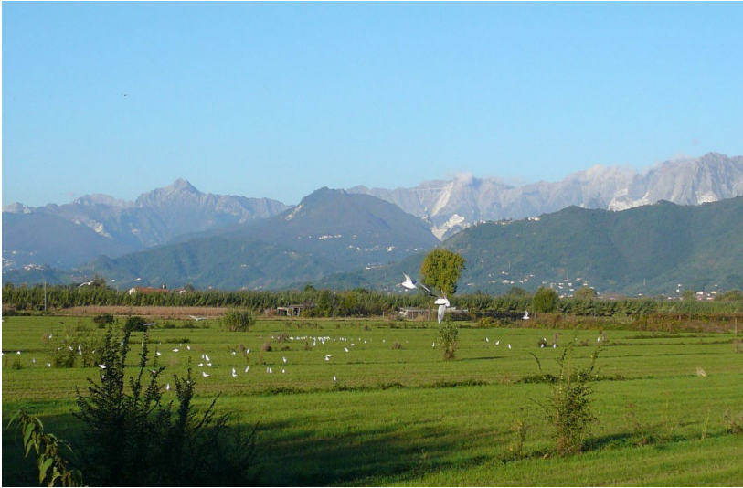
Costa die Marmi, dahinter die Marmorbrüche bei Ferrara