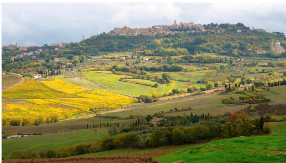
Montepulciano Bei Orvieto