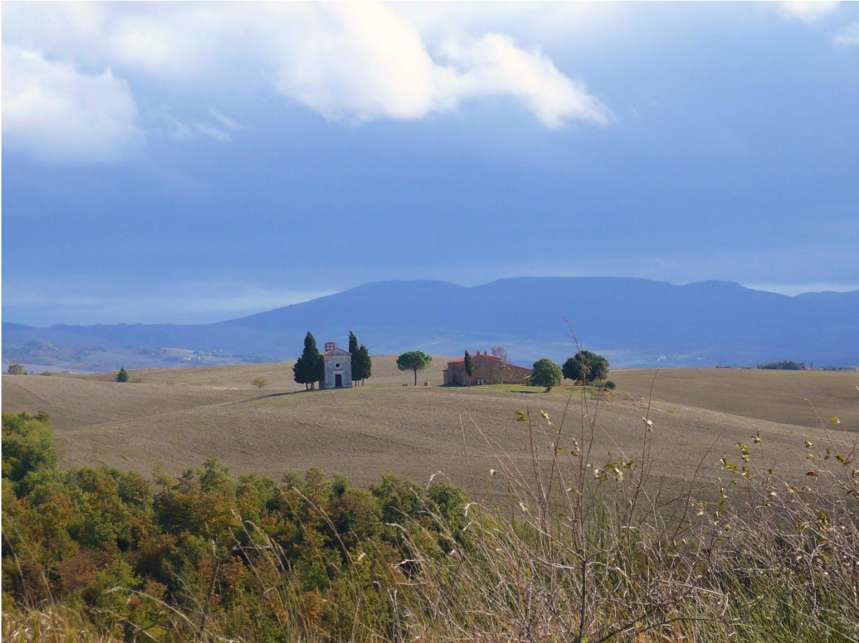
LE Crete, einzigartig