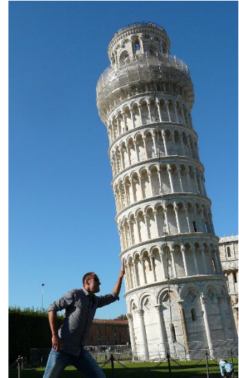
Fall bloß nicht um, wir kommen